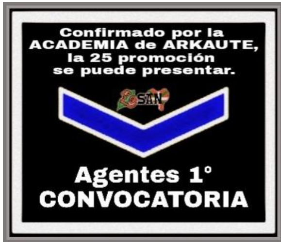
Nota de ESAN

El Departamento y los firmantes engañaron a los compañeros/as de la 25ª promoción al hacerles creer que podían presentarse a la convocatoria de Agente 1º en 2018