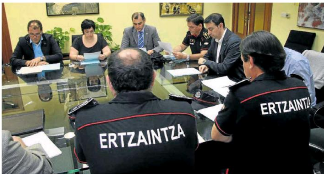
Mandos de la Ertzaintza ajenos a esta información participan en una reunión con responsables municipales de la Margen Izquierda.